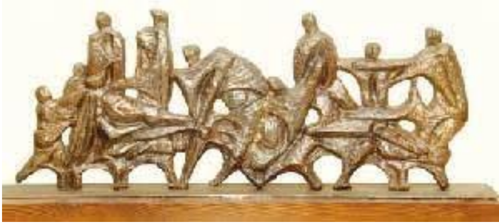
عمل الفنان: محمد غني حكمت

النحت المعروض يبدو أنه مصنوع من الخشب، وهو مادة طبيعية يمكن أن تكون مستدامة إذا تم حصادها بطرق مسؤولة بيئيًا. الخشب مورد قابل للتجديد، ويمكن أن يكون له تأثير بيئي منخفض نسبيًا مقارنة بالمواد الأخرى إذا تم إدارته بشكل صحيح.