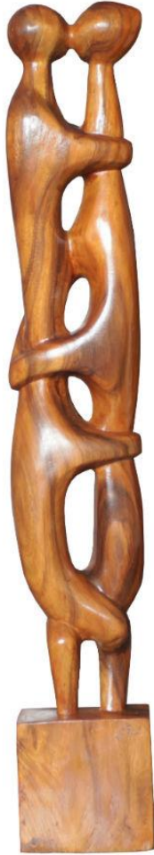
عمل النحات: محمد غني حكمت