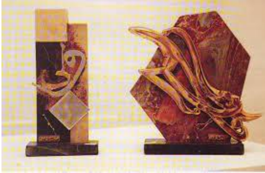
عمل الفنان: خالد الراحال